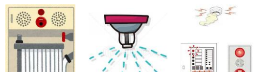
1 屋内消火栓設備 2 スプリンクラー設備 3 自動火災報知設備

ホテル、飲食店、物販店など不特定多数の方が利用する建物や病院、社会福祉施設など一人で避難することが難しい方が利用する建物で、次の消防用設備等が設置されていない違反対象物を小田原市のホームページに掲載します。